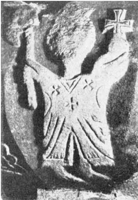
Diese Figur mit Streitaxt und Kreuz deutet der Verfasser als eine Darstellung von Gottvater

gefressenen Gestühl wirkte wie ein Symbol des Krieges und seiner Sinnlosigkeit. Und doch hatte manche Stiftung frommer Bürger die Feuersbrunst überstanden: Die Kanzel mit ihrer Gittertür, Epitaphien und die Schranke, hinter der sich der Taufstein barg. Wie viele Königsberger hatten diesen Stein wohl genauer betrachtet, diesen Recken aus Gotland, der spätestens seine Gestalt im Jahre 1350 erhielt, dessen Stoff aber in Urzeiten hinabreichte? Wer sich die Mühe nahm, die acht Abschnitte der Außenschale mit einer Taschenlampe abzuleuchten, entdeckte seltsame Figuren darauf. Am auffallendsten war die des Herrschers mit Reichsapfel und Streitaxt, die von Händen gehalten wurden, die armlos am Körper saßen. Wäre der Reichsapfel nicht gewesen, hätte man meinen können, dies Relief stelle den Heiligen Olaf dar, der im Nordland das Christentum mit Schwert und Blut ausgebreitet hatte; denn das Symbol dieses Heiligen ist die Streitaxt, die in Skandinavien beliebteste Waffe. So aber müssen wir diese Figur wohl als eine Darstellung von Gottvater werten. Es lohnt sich schon, diese Gestalt etwas näher anzusehen: die seitwärts gedrehten Füße, die Kreuzeszeichen, die stark an das Eiserne Kreuz erinnern, und den roh angedeuteten Bart. Immerhin hat der Steinmetz aus dem spröden Material all das herausgeholt, was er berichten wollte.