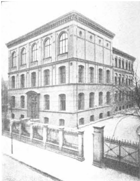
Das Schulgebäude des Wilhelmsgymnasiums

Im Jahre 1954 jährte sich zum achtzigsten Male der Tag, an dem eine der bekanntesten höheren Schulen Ostpreußens, das Wilhelmsgymnasium in Königsberg, gegründet wurde. Bis dahin hatte neben den beiden städtischen Anstalten („Kneiphof“ und „Altstadt“) nur ein „Königliches“ humanistisches Gymnasium, das Friedrichskollegium, bestanden. Aber die Bevölkerung der „Haupt- und Residenzstadt“ war so gewachsen, dass im Jahre 1874 eine zweite Schule gleicher Art vom Staate errichtet wurde. Ein nüchterner Bau aus gelben Klinkern entstand auf dem Hintertragheim Nr. 13; das zugehörige Gelände erstreckte sich bis zum Schlossteich, an dessen Ufer, idyllisch gelegen, das Haus des Schulleiters stand.