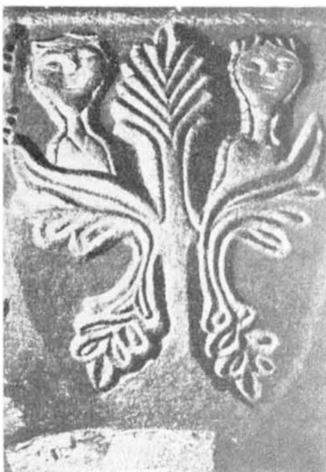
Baumgeister spähen über die Zweige